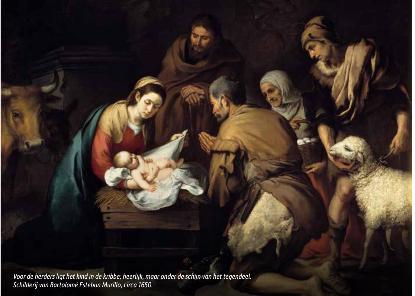
Voor de herders ligt het kind in de kribbe; heerlijk, maar onder de schijn van het tegendeel. Schilderij van Bartolomé Esteban Murillo, circa 1650.

vlees geworden is, dat Hij onder ons heeft gewoond. Hij legt Zijn heerlijkheid af; verbergt die voor onze zondige ogen, opdat wij niet door de gloed ervan verteerd zouden worden. C.H. Spurgeon zei in een preek: 'Voor Christus was het veel minder moeilijk om Zijn heerlijkheid te laten zien dan om die in te houden en te verbergen. Het is voor eeuwig Zijn heerlijkheid dat Hij Zijn heerlijkheid bedekte.' Hij nam vlees aan, zondig vlees, het vlees van mijn vijandschap en verzet tegen God. Het is Zijn heerlijkheid dat Hij in Zichzelf de reinigmaking van zonden teweeg heeft gebracht (Hebr.1:3). Zijn heerlijkheid is dat Hij arm werd om velen als kinderen tot de rijkdom van Zijn heerlijkheid te leiden (Hebr.2:10). We krijgen, ook bij Kerst, genoeg van Zijn heerlijkheid te zien om het leven te vinden. En tegelijkertijd toont Hij te weinig van Zichzelf om onze honger al volledig te stillen. Door iets van Zijn heerlijkheid te laten proeven neemt onze honger juist toe, opdat we ons met volharding uitstrekken naar de komende heerlijkheid. Als het zien van Zijn verborgen heerlijkheid nu al het leven is, wat zal het dan zijn om Hem straks te zien in de heerlijkheid van Zijn hemelse gedaante.